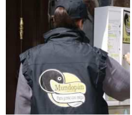
Una repartidora deja el pan en la casa un cliente