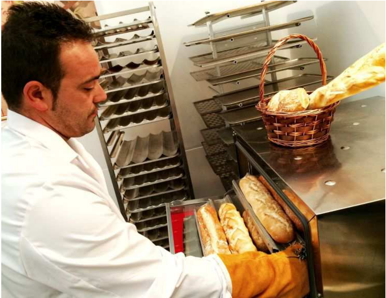
Horno de la panadería Mundopán en Rivas Vaciamadrid

Una pequeña empresa de reparto de pan a domicilio fundada hace diez años por dos amigos madrileños se ha expandido por varias comunidades españolas y planea saltar al extranjero